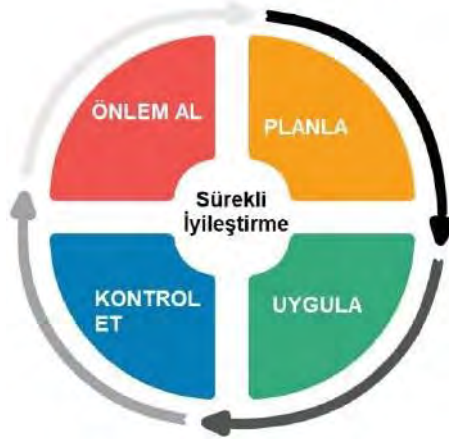
Şekil 1. PUKÖ Döngüsü

Yukarıda belirtilen adımlar özetle Planla-Uygula-Kontrol Et-Önem Al (PUKÖ) yaklaşımı olarak ifade edilebilir